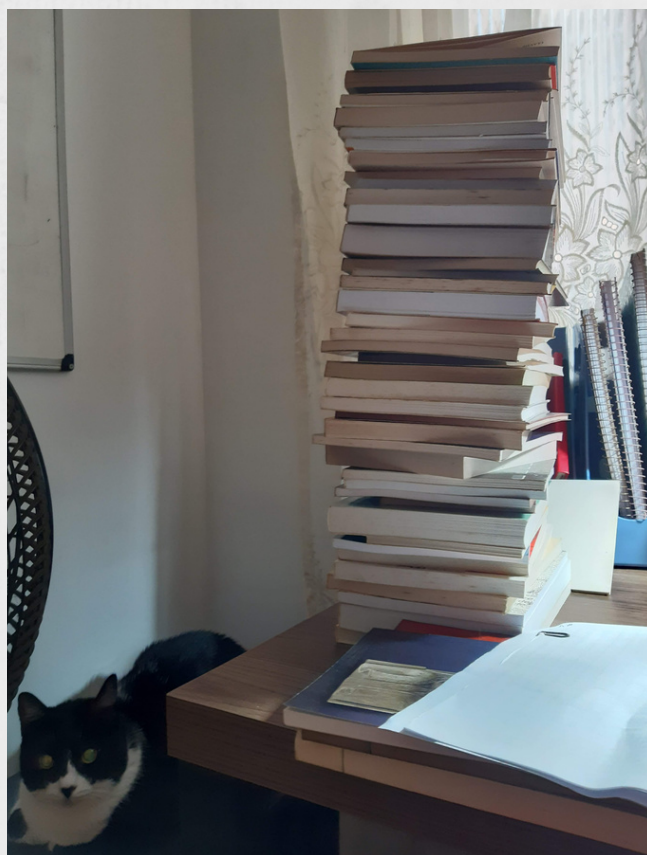
Imagem: Livros empilhados para serem catalogados remotamente

Após o tombamento, passa-se à triagem. Neste processo, é realizada uma pesquisa para determinar se a obra pertenceu ao antigo acervo da BFK perdido no incêndio ou, ainda, se ela já foi catalogada por outra biblioteca da UFRJ, constando na Base Minerva - o catálogo da UFRJ. Quando já há o registro, passa-se direto à etapa de inserção do item no sistema. No caso das obras que necessitem de catalogação, elas são encaminhadas à equipe de bibliotecárias para este fim, e, após a catalogação, o item é inserido.