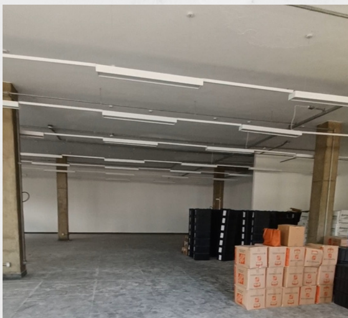
Imagem: Caixas de livros doados no espaço da BFK no prédio do Horto Botânico

No segundo semestre de 2022 deu-se continuidade às atividades e trabalhos que estavam sendo desenvolvidos anteriormente pela equipe da BFK. Durante esse semestre, deu-se também o início do projeto arquitetônico das instalações da BFK no prédio do Horto Botânico.