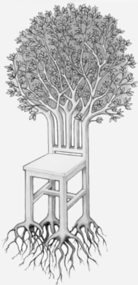
Ex libris da nova BFK Ilustração de Vitória Taborda