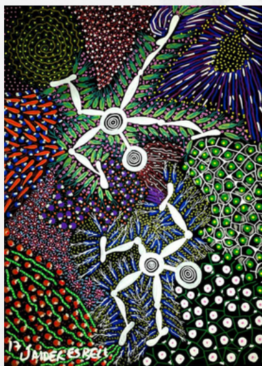
Imagem: Obra de Jaider Esbell ( reprodução )

Na primeira parte deste artigo, publicada no número anterior de Mana , dedicamo-nos à análise crítica do texto de Kelly e Matos (2019). Investigamos suas premissas fundamentais, bem como revisitamos as etnografias de Gow (1991), Surallès (2009) e Allard (2010), que lhes fornecem a base empírica para seus argumentos. Mostramos como eles utilizam os dados de forma extremamente se-